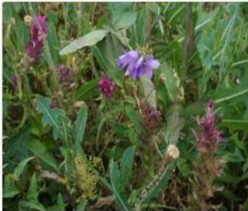
Wildkrautacker (Rüdiger Vettermann)