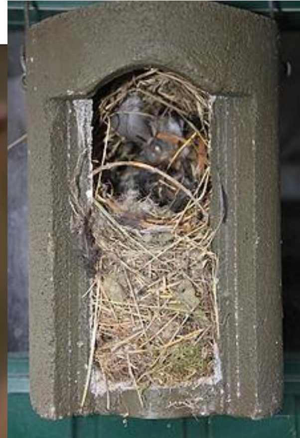
Feldsperling / Tree Sparrow ( Passer montanus )